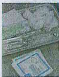
Insumos médicos.