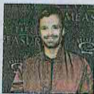
Actor Sebastian Stan.

ML | Lily James, el antiguo interés amoroso de Chris Evans, trabajará con el actor Sebastian Stan, amigo del intérprete de "Capitán América". Las estrellas están listas para interpretar a Pamela Anderson y a Tommy Lee en una próxima serie de Hulu.