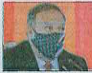
Mike Pompeo.

El jefe de la diplomacia de Estados Unidos, Mike Pompeo, se puso en cuarentena después de haber tenido contacto con una persona que dio positivo al covid-19, anunció el Departamento de Estado estadounidense. "El secretario de Estado fue testado y dio negativo", precisaron.