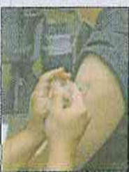
Vacunación.