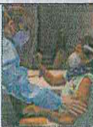
Atienden una persona.

vid-19. La vacuna de BioNTech, producida en colaboración con la estadounidense Pfizer, ya ha recibido luz verde para su comercialización en varios países, como el Reino Unido y EE.UU., donde se inició e administrat.