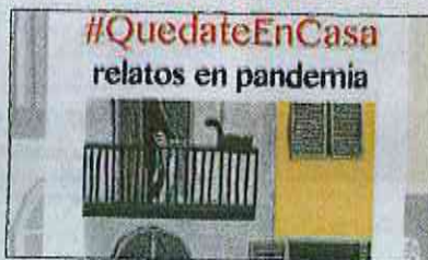
EDITORIAL BELLOS | La portada del libro "Relatos en Pandemia".

Cartas de des/amor, e-mails equivocados, estrellas en el cielo de Van Gogh, un viaje a la Europa del futuro, venganzas en el baño, luminosos nacimientos, extraterrestres que traen la cura del virus, expedi-