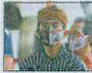
AFP | Joko Widodo.

AFP | El presidente Joko Widodo anunció que será el primer indonesio en recibir la vacuna contra el covid-19, durante una campaña que será gratuita para todos. "Anuncio hoy que la vacuna contra el covid-19 será gratuita para todos los ciudadanos. Y que yo seré el primero en recibirla".