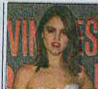
La actriz Eliza González.

◆ Travis Scott llamó molesto a Kylie Jenner por tomar una foto hermosa de él y su hija Stormi, de dos años.