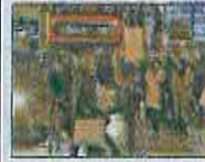
AFP | Personas caminando.

AFP | Locales de restauración y de ocio volvieron a cerrar en Londres, solo dos semanas después de que Inglaterra saliese de su segundo confinamiento, ante una disparada en los contagios por el nuevo coronavirus, lo que llevó al gobierno a pedir prudencia durante la fiestas navideñas.