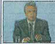
AFP | Lorin Moreno.

AFP | La mitad del millón de desempleados que dejó la crisis provocada por la pandemia de covid-19 en Ecuador volvió a trabajar, dijo el presidente del país, Lorin Moreno. "En la pandemia se sumaron un millón de desempleados a esta cifra (de unos 300.000 a diciembre de 2019)".