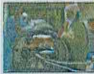
AFP | Personal sanitario.

AFP | La región de América registró casi cinco millones de casos por covid-19 la semana pasada, una tendencia impulsada por el avance de la epidemia en Canadá y EE.UU., informó la Organización Panamericana de la Salud (OPS). "Solo la semana pasada, hubo casi cinco millones".